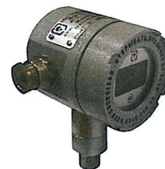
Рисунок 9 Датчик давления «ГиперФлоу», модели ДИ-020, ДА-021