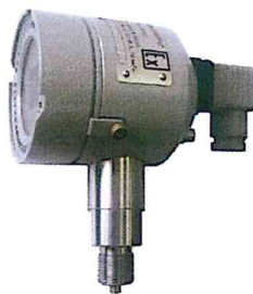
Рисунок 5 Датчик давления «ГиперФлоу», модели ДИ-012, ДА-013