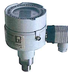
Рисунок 3 Датчик давления «ГиперФлоу», модели ДИ-008, ДА-009