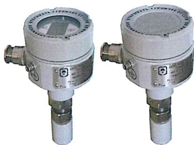
Рисунок 4 Датчик давления «ГиперФлоу», модели ДИ-010, ДА-011