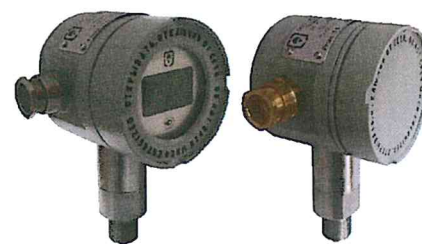
Рисунок 6 Датчик давления «ГиперФлоу», модели ДИ-014, ДА-015